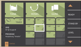
Touchdisplay (staub- & schmutzresistent)